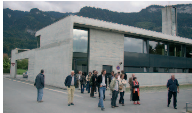
Vingt cinq élus, conseillers généraux, maires, maires adjoints... face à l'expérience du Vorarlberg

Le CAUE de Haute-Savoie a proposé aux élus du département, un voyage dans le land autrichien du Vorarlberg les 29, 30 septembre et 1er octobre 2005. En effet, les enjeux du développement durable sont aujourd'hui partagés par un nombre croissant de maîtres d'ouvrage, de concepteurs et de gestionnaires. Ce voyage d'études a été l'occasion d'appréhender, dans une région similaire à la nôtre, la nouvelle identité du Vorarlberg au travers de son architecture, mais aussi de son approche qualitative de l'urbanisme et des déplacements. La rencontre d'architectes et d'élus locaux a permis de répondre à de nombreuses interrogations.