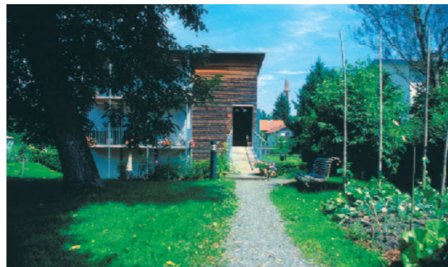
Logements passifs et atelier d'artiste, résidence "Olzbundt" à Dorbind, 1997, architecte : Hermann Kaufmann

Cette expérience vécue a élargi le champs des possibilités, pour mieux appréhender le confort de notre cadre de vie : renouer avec l'envie d'une idéologie plus en rapport avec notre temps."