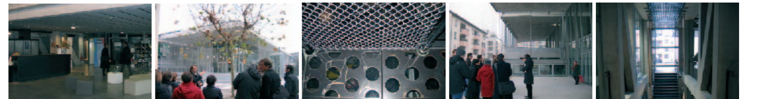
visite de la Turbine