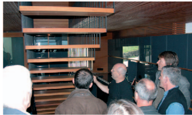
Logements passifs et atelier d'artiste, résidence "Olzbundt" à Dorbind, 1997, architecte : Hermann Kaufmann