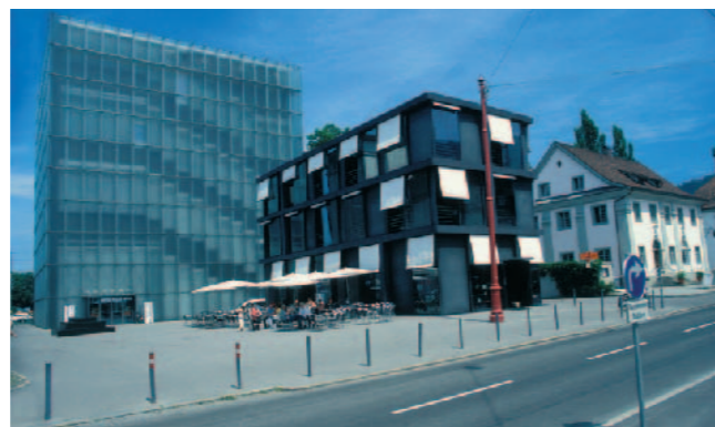
Maison des Arts de la ville de Bregenz, 1997, architecte : Peter Zumthor