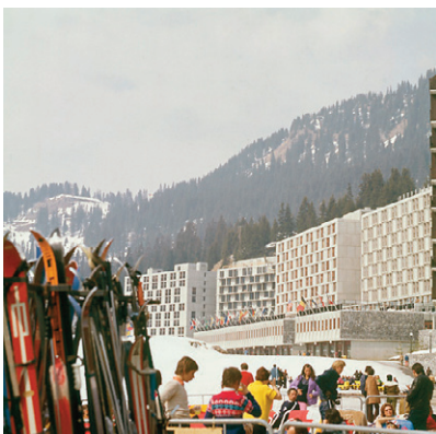
Vue générale du Forum, 1969.