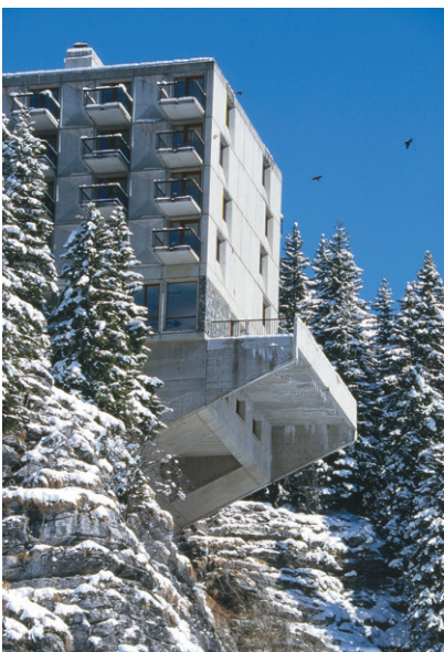
Hôtel Le Flaine dans les années 1990.

Inscrite dans le fort désir d'architecture de son maître d'ouvrage Éric Boissonnas, Flaine prend une place singulière dans le paysage des stations de sports d'hiver de l'après-guerre. Si Marcel Breuer imagine un modèle urbain rapidement interrogé par les exigences de la montagne, il y développe surtout une approche plastique personnelle. Inaugurée pour partie en janvier 1969, Flaine offre de précieux éclairages sur sa démarche... B.C.