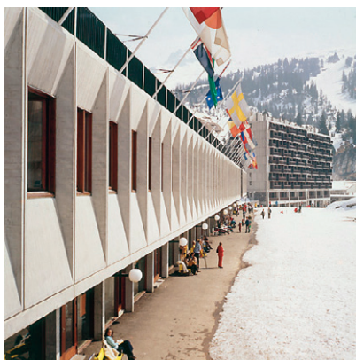
Façade des commerces sur le Forum, 1969. © Véra Cardot & Pierre Joly / MNAM.

À la suite du siège de l'Unesco livré à Paris en 1958, l'Américain Marcel Breuer (1902-1981) obtient plusieurs opérations en France qui le conduisent à construire un savoir-faire à grande échelle : le centre de recherches IBM à La Gaude, Alpes-Maritimes (1961), la station de ski de 7000 lits de Flaine, au cœur du massif Arve Giffre en Haute-Savoie (1960-1976), la ZUP de 15000 habitations de Bayonne, Pyrénées-Atlantiques (1963-1970). Ces programmes amorcent une activité confortable et autorisent l'architecte à se détacher de la tutelle de l'ancien maître du Bauhaus, Walter Gropius, pour affirmer une écriture personnelle, au point qu'on pourrait dire, avec Mario Jossa, l'un de ses anciens collaborateurs, que « tout a commencé en France ».