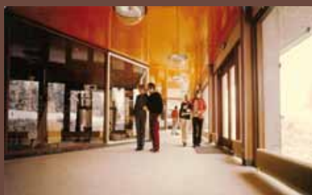
Images issues d'un prospectus publicitaire des années 60-70, vantant les atouts de la nouvelle station.