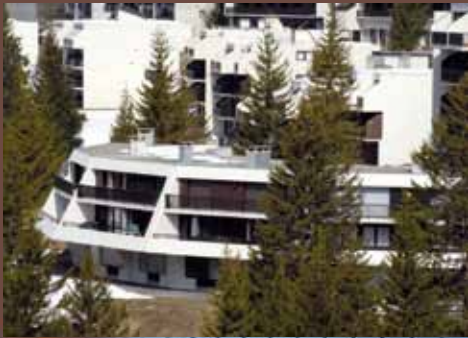
Les Grands Vans (1978 - 1979)