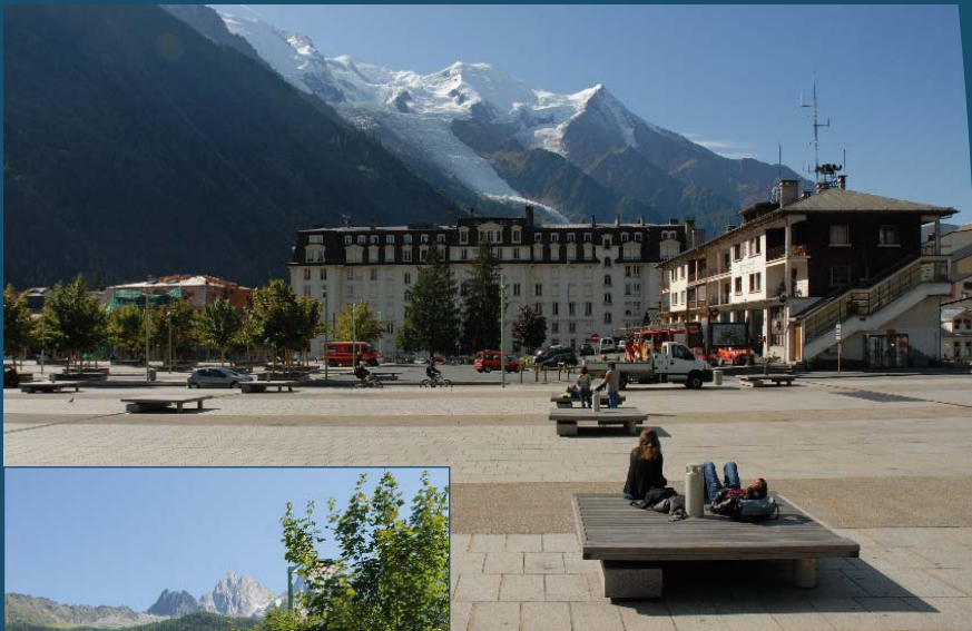
Le renouveau de la place du Mont-Blanc : pour un espace plus convivial au cœur de la ville.

Cet engagement politique fort ne peut être efficace qu'avec la pleine participation de tous les acteurs du territoire. Élus, habitants, professionnels de la montagne, aménageurs, promoteurs... ils ont tous concernés par l'avenir de nos stations. Mais c'est aussi à nous, touristes responsables, d'agir et de devenir porteurs du changement, de faire les bons choix pour que la montagne reste vivante.