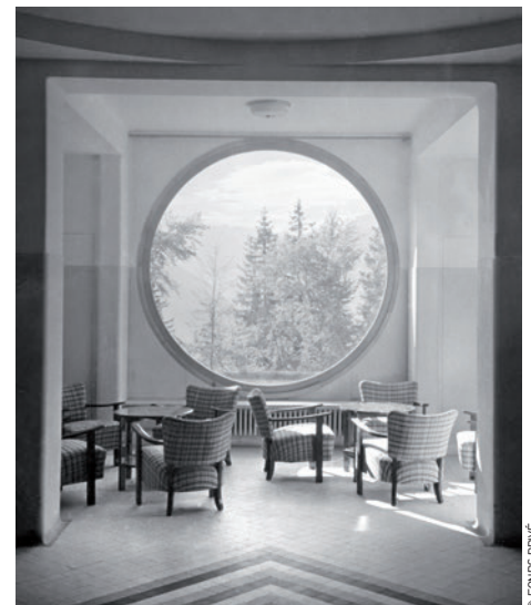
Un salon du sanatorium, Martel-de-Janville, Passy (74).