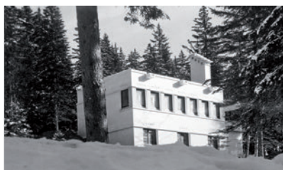
Villa du médecin directeur, sanatorium Guébriant, Passy (74).